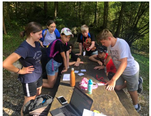
Poste du jeu de piste