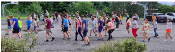
Jerusalema ... le camp de la FJM aussi l'a fait!