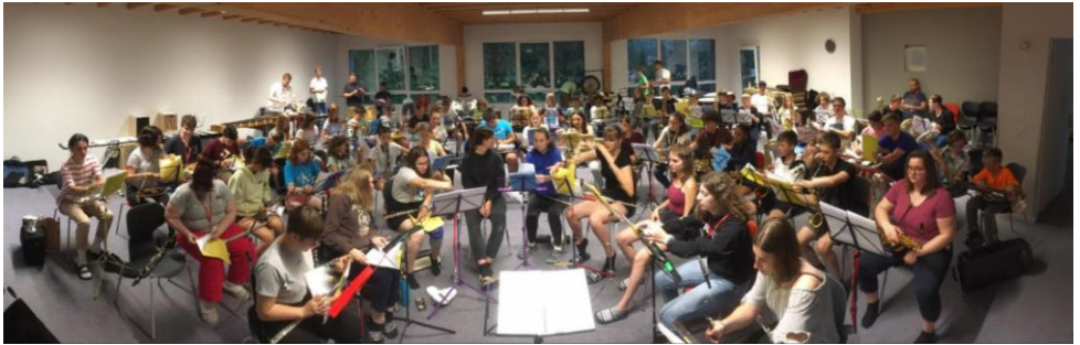
Les 2 ensembles en répétition