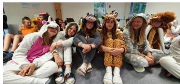
Prêtes pour la soirée du jeudi