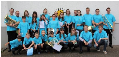
1er rang JMJ 2017 à Courtételle : Jeunesse Music'Alle

La prochaine fête des JMJ se déroulera le 30 octobre prochain à Courtemaîche et Courchavon avec pas moins de 16 ensembles inscrits. Ce seront donc près de 400 jeunes musicien-ne-s issus des sociétés de la FJM qui se produiront sur scène lors de cette journée, soit en audition devant jury, soit en concours.