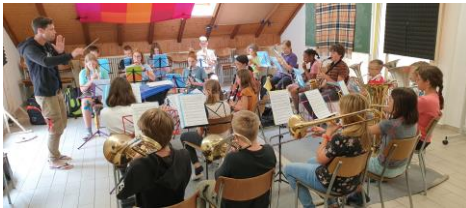
L'ensemble «Les Dinos» en répétition