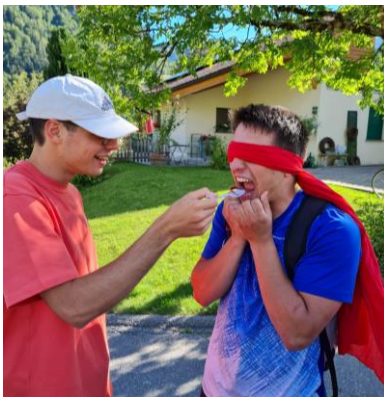
Aïe aïe aïe qu'est-ce que je vais devoir goûter!