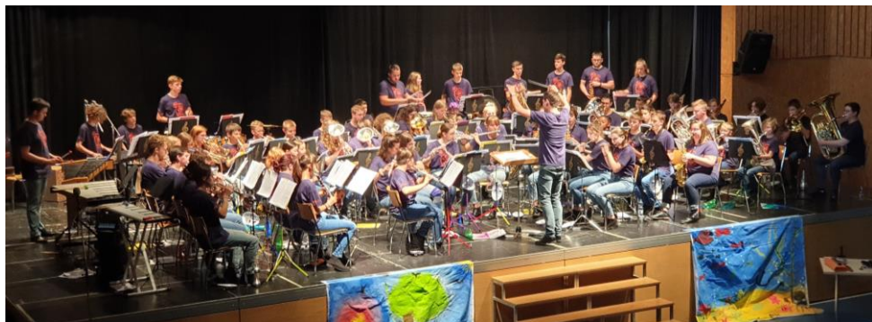
En concert à Glovelier