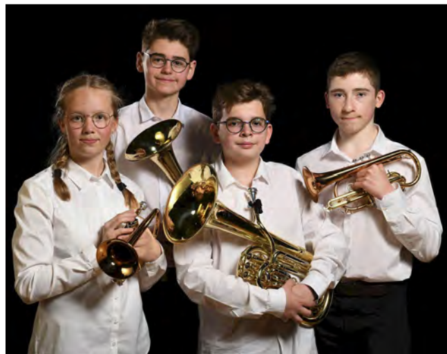
Hydra Brass Quartet, meilleur ensemble junior