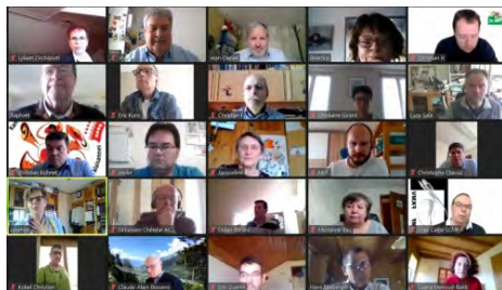
Visioconférence de la RRT 2021

Les Associations des musiques Romandes et Tessinoise se sont retrouvées en visioconférence, organisée par la SCMV, le 17 avril 2021. Seuls les Comités centraux et Service des membres se sont rencontrés. Les Commissions de musique et la Commission de tambours n'ont pas échangé.