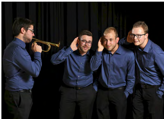
Illumination Brass Quartet, champion « Ensembles à vent »