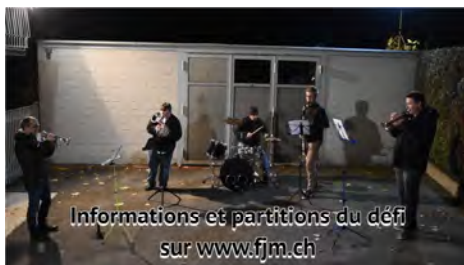
Les 5 membres de la commission de musique lancent le premier défi

Un grand merci à la commission de musique de la FJM qui a imaginé ce challenge dans le but de renforcer les liens entre les sociétés et de motiver les musiciens à jouer en petits groupes. A ce jour, une dizaine de sociétés ont relevé ce défi en publiant des vidéos fort sympathiques sur les réseaux sociaux. Bravo à toutes et à tous et bonne suite au challenge FJM-Coronavirus.