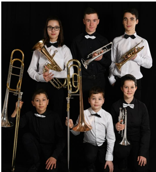
Malamala, champion "Ensembles - Junior"