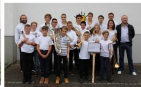
Fête des JMJ le 29 octobre 2017 à Courtételle

Depuis, nous avons eu des échanges avec la fanfare « Les Echos du Val Terbi » de Corban qui souhaitait reporter au 25 avril 2021 le même week-end que le festival du Val-Terbi, mais sans montage d'une grande halle-cantine. Pour des questions de date, 3 semaines avant la Fête fédérale, et de manque de place dans les infrastructures proposées, organisateurs et FJM n'ont pas trouvé d'accord. Par conséquent, il n'y a, malheureusement, plus d'organisateur de fête des JMJ à l'heure actuelle.