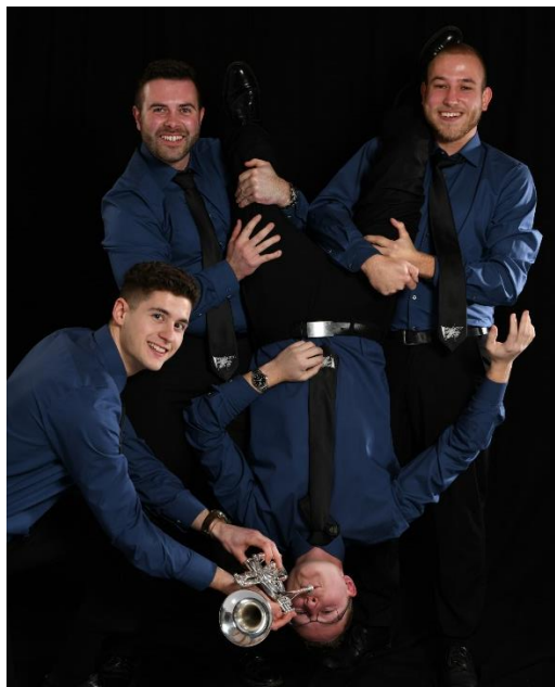
Illumination Brass Quartet, champion "Ensembles à vent"