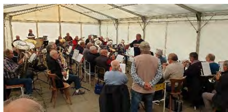
Travail et amitié, le ton est donné !

Le but de ce camp, comme chaque année, est destiné à peaufiner dans la bonne humeur le concert de la cérémonie d'ouverture de la Foire du Jura à Delémont.