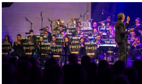
L'ECJ pendant une représentation de Edith&ABBA