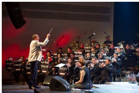
L'ECJ pendant une représentation de Starmania