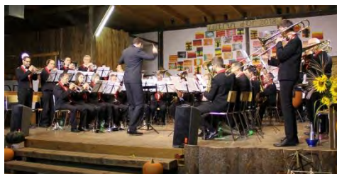
EC la Covatte, Coeuvre