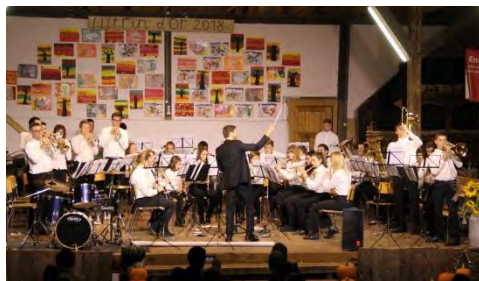
EJMA (Ensemble Jeunes Musiciens d'Ajoie)