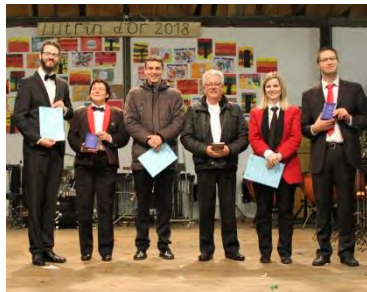
Groupe A EC la Covatte, Coeuvre (1er) Brass Band Lignières – Harmonie Prêles (2e) Fanfare l'Espérance, Chevezey (3e)