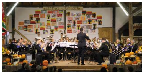
Brass Band Lignières-Prêles