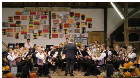
Musique-Fanfare de Saignelégier