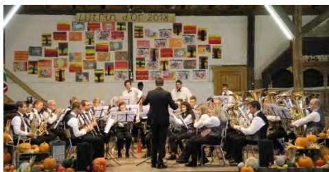
Fanfare l'Ancienne, Courgenay