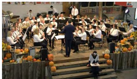
Fanfare de Courtételle