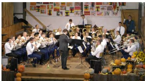
Fanfare de Montsevelier