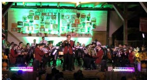
Fanfare L'Espérance, Chevezey