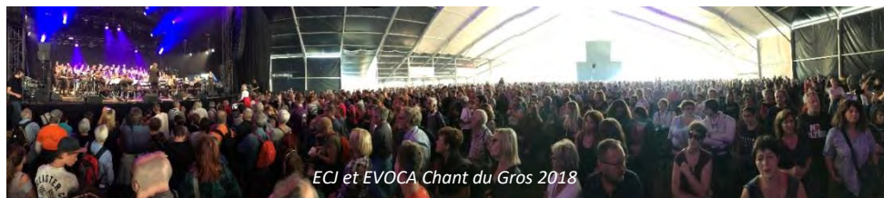
ECJ et EVOCA Chant du Gros 2018