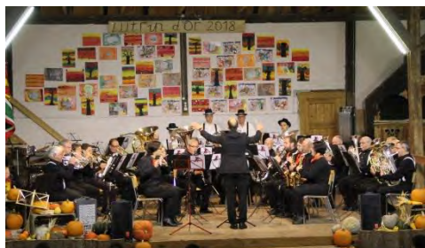
Fanfare Le Noirmont