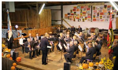
Echo de la Haute-Roche, St-Brais-Montfaucon-Les Enfers