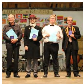
Groupe B Fanfare le Noirmont (2e) Union Instrumentale Delémont (3e) La Montagnarde Epauvillers (1er)