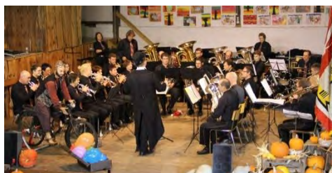
La Montagnarde, Epauvillers