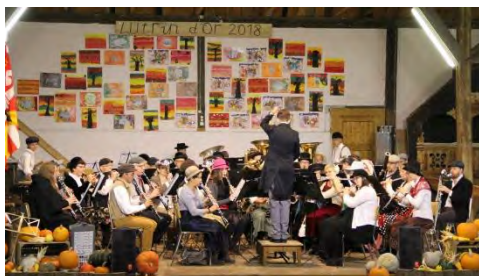
Union Instrumentale Delémont