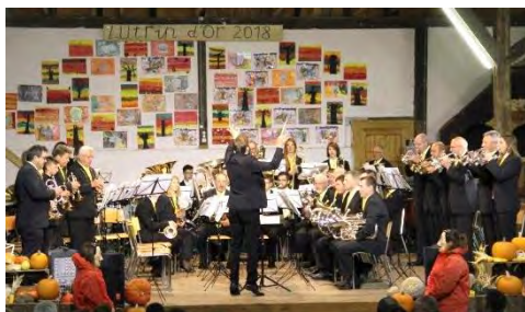
Sté de Musique La Persévérance, Grandval