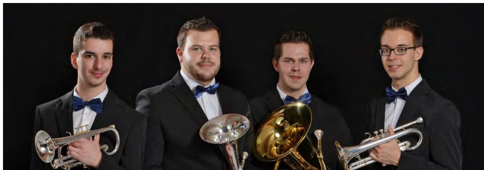
Ostfold Brass Quartet, champion "Ensembles à vent"