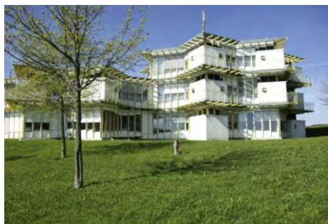
CIP (Centre interrégional de perfectionnement)

L'entrée se dégustera le vendredi 14 juin 2019 à la salle de la Marelle avec un apéritif de bienvenue. Le plat principal vous surprendra par son humour et sa bonne humeur et vous invitera au dessert que vous goûterez dès samedi 15 juin pour se terminer par un bouquet final le dimanche 16 juin aux environs de 18h30.