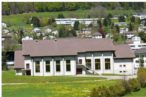
Salle de la Marelle

Le lieu des festivités est le quartier des Lovières avec 2 salles de concours (Marelle et CIP) et des locaux de « chauffe » (CEFF-Commerce) tandis que la restauration et les productions occuperont la patinoire, revisitée pour l'occasion afin d'échanger la glace contre une diffusion de chaleur et de bonne humeur.