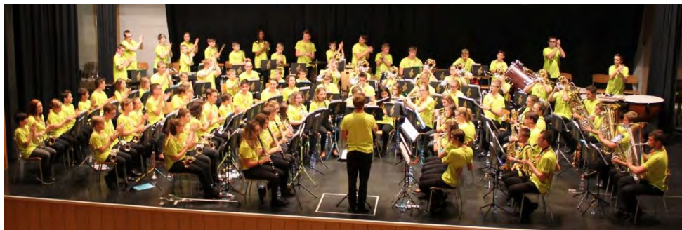
Concert final du camp 2017 à Tramelan