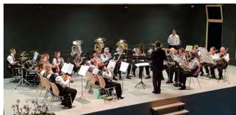
La Fanfare Echo du Bueberg en concert

Voici déjà une année que le comité d'organisation de la 9 e édition du Lutrin d'Or s'est rassemblé pour la première fois, et le 27 octobre 2018 approche maintenant à grands pas. C'est un plaisir pour la Fanfare Echo du Bueberg, ainsi que pour le comité d'organisation ad-hoc, d'organiser cette fête de la musique. Le sérieux de chacune et de chacun nous permet d'envisager cette manifestation sous les meilleurs auspices. Organisation du concours, repas de fête, animation musicale folklorique, cantine et petite restauration pour l'après-midi, bar Halloween pour la soirée, transports nocturnes pour le retour, tout sera prêt !