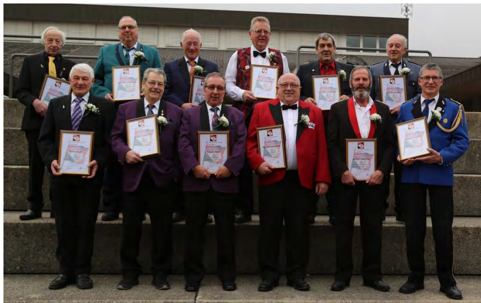
Les vétérans jurassiens pour 50 ans de musique