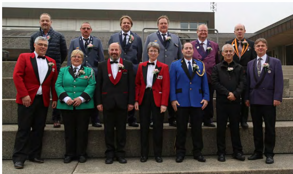
Les vétérans fédéraux pour 35 ans de musique