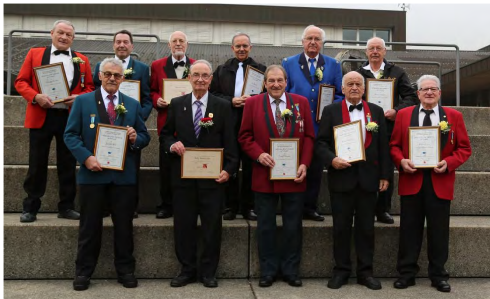
Les vétérans CISM pour 60 et 70 ans de musique