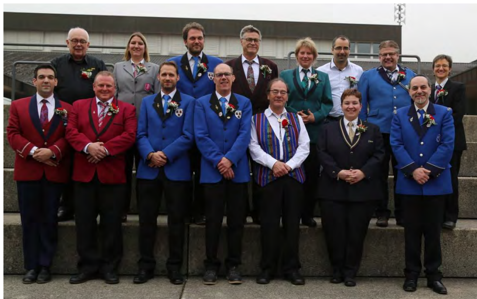
Les vétérans jurassiens pour 25 ans de musique