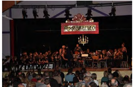
Musicavenir (spectacle Musicabello)