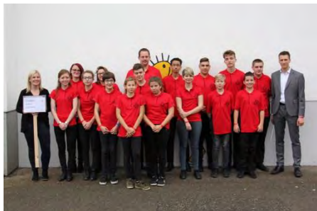
Cadets Espérance Courfaivre