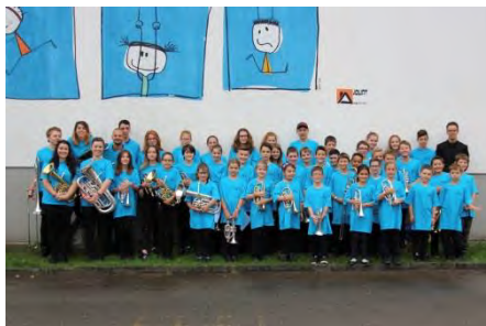
MCM (Montsevelier, Corban, Mervelier)