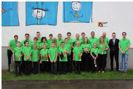
Cadets de Courroux-Courcelon