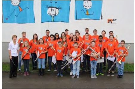
Musique des Jeunes Courgenay