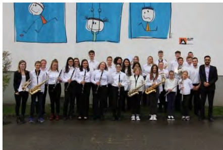
ECFAC (Cornol) et Cadets Fanfares Réunies Courtemaîche