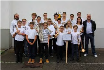
Orchestre Pitchisson (Fontenais-Villars, Porrentruy, Bure)