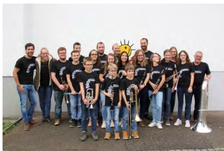
Jeunes musiciens ensemble à vent Tramusica, Tramelan