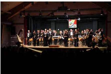
Blasorchester Stadtmusik Luzern