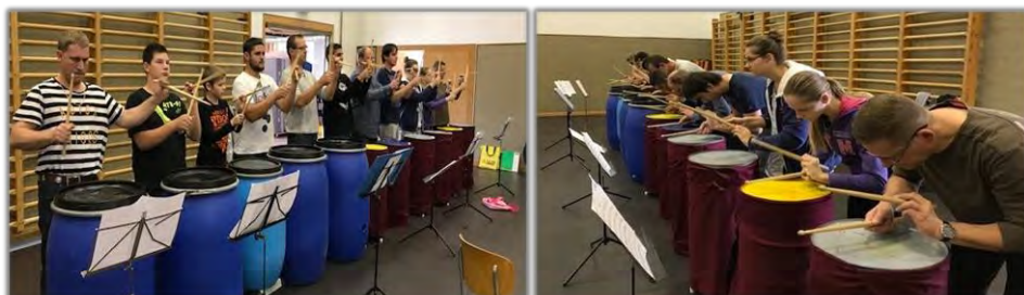
Photos : le groupe de tambours FJM en répétition pour les JMJ à Courtételle.