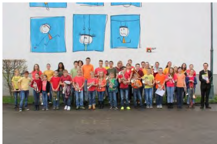
B-BAM (Chevenez, Coeuve, Buix, Vendlincourt)