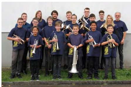
Junior Brass Grandval