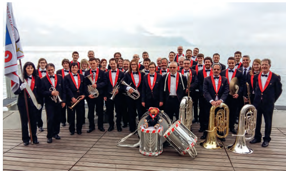
Ensemble de Cuivres la Covatte Coeuve