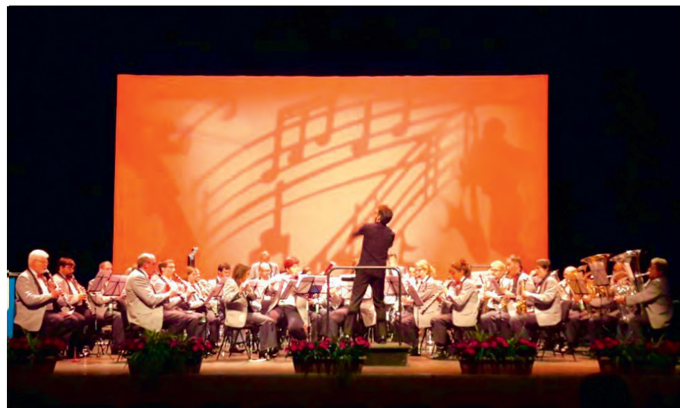
Corps de Musique St-Imier