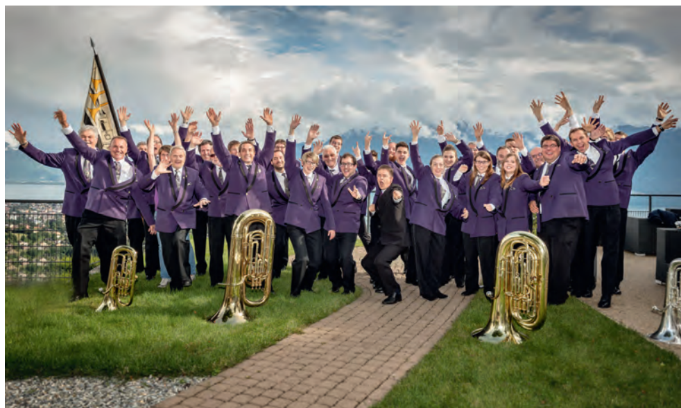
Fanfare L'Ancienne Courgenay