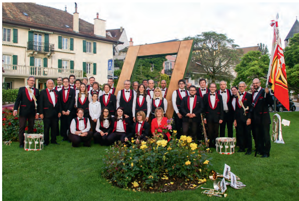
Ensemble de Cuivres Concordia Mervelier