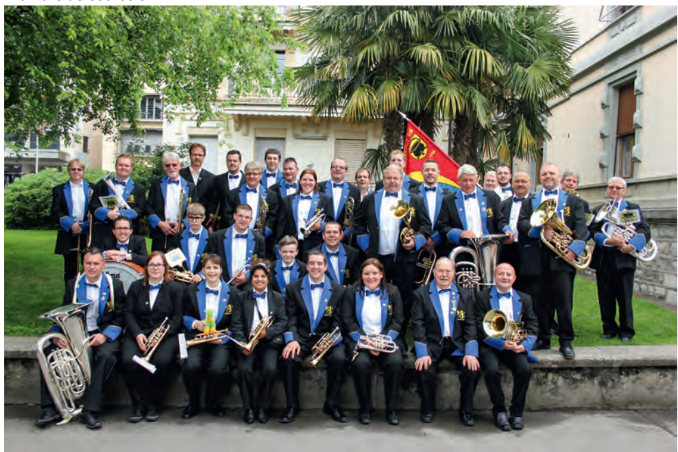
Fanfare Harmonie Prêles