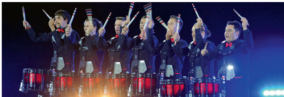
Photos : Le groupe de tambours valdo-neuchâtelois Majesticks Drum Corps ( www.majesticks.ch )