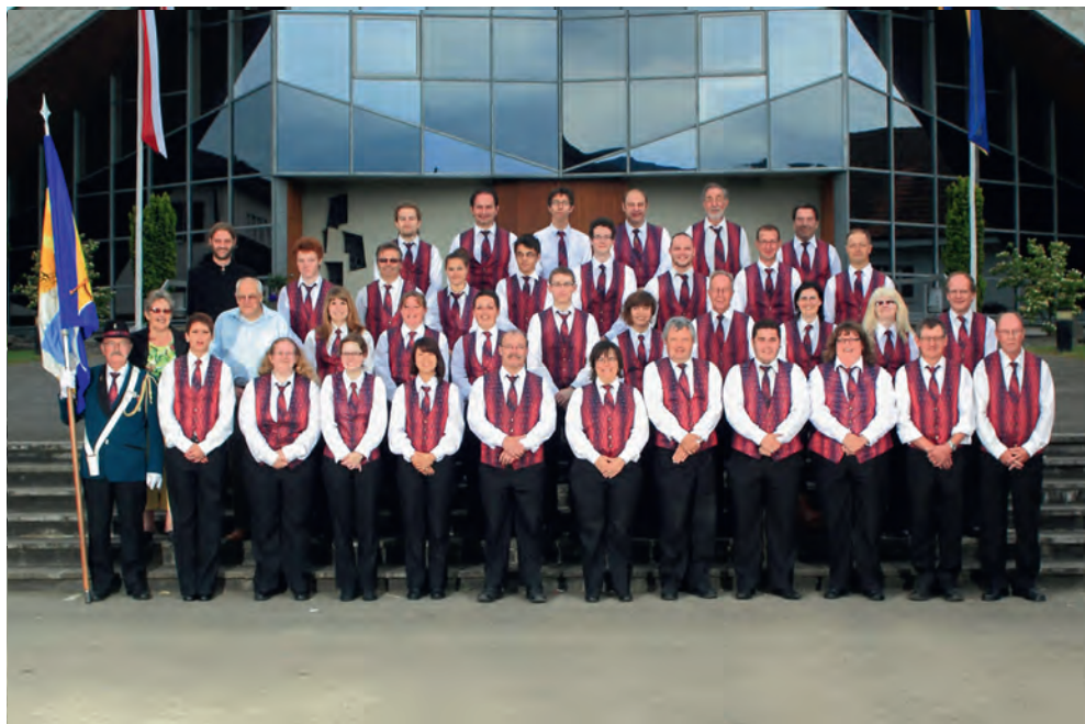
Fanfare Les Breuleux