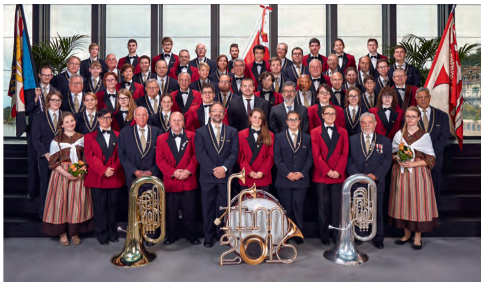
Ensemble Fanfare l'Ancienne et Fanfare le Grütli Alle