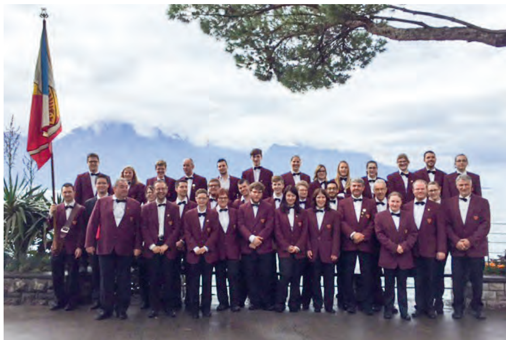
Fanfares Réunion Courtemaîche