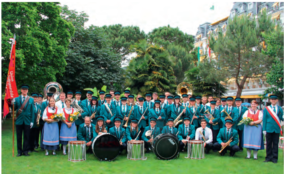
Union Instrumentale Delémont