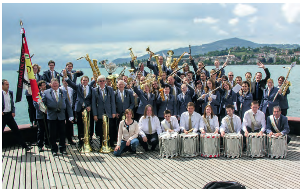
Fanfare de Courtételle