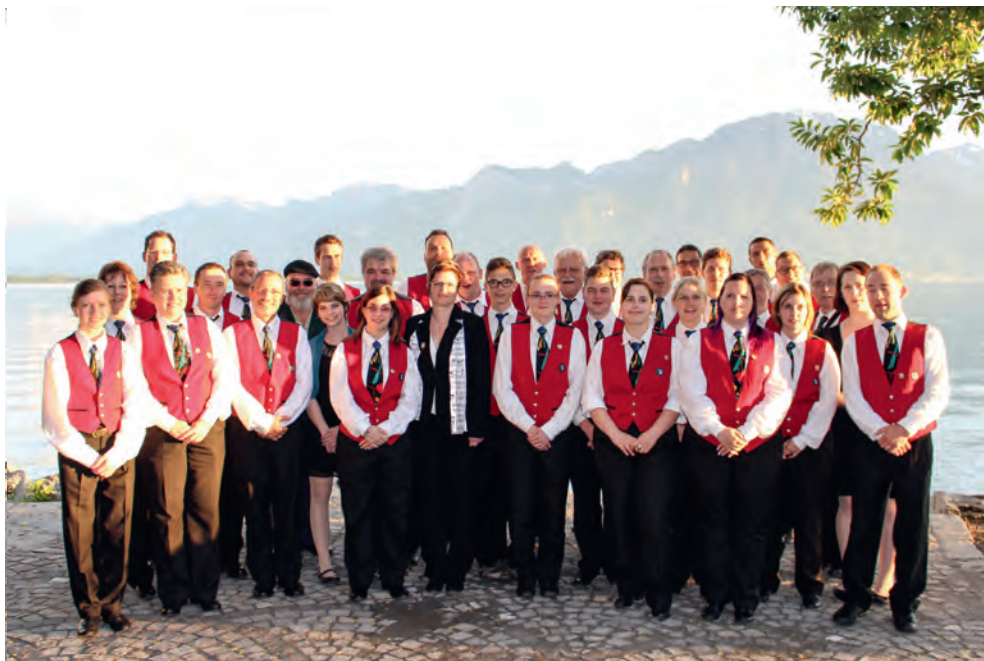
Fanfare L'Espérance Courfaivre