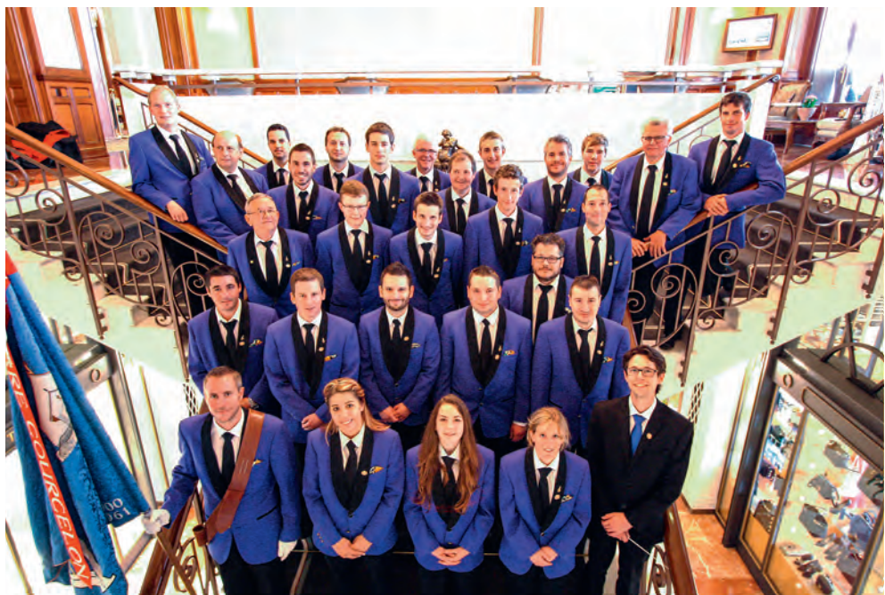
Fanfare de Courcelon