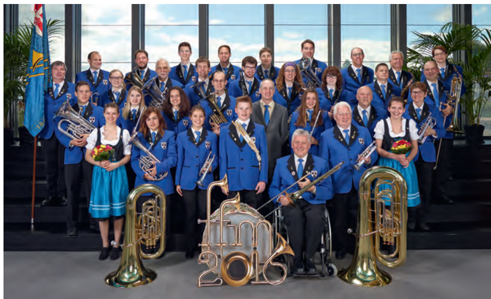
Fanfare L'Ancienne Cornol