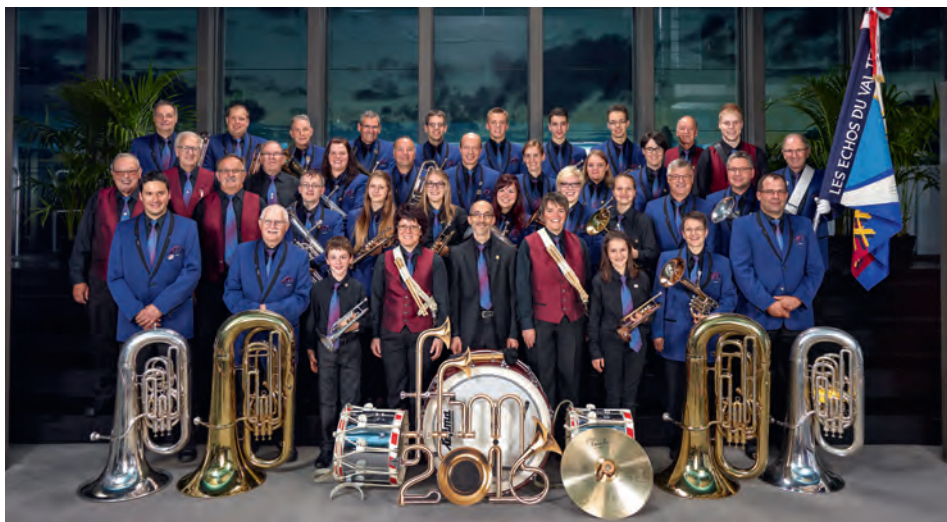
Les Echos du Val-Terbi Corban