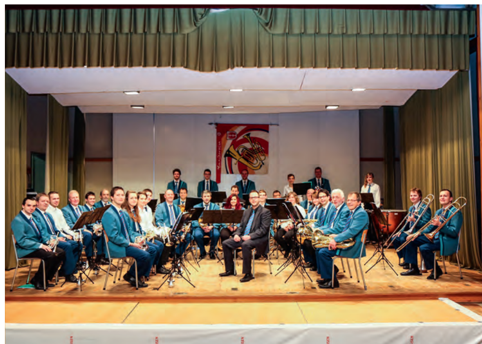
Fanfare de Montsevelier