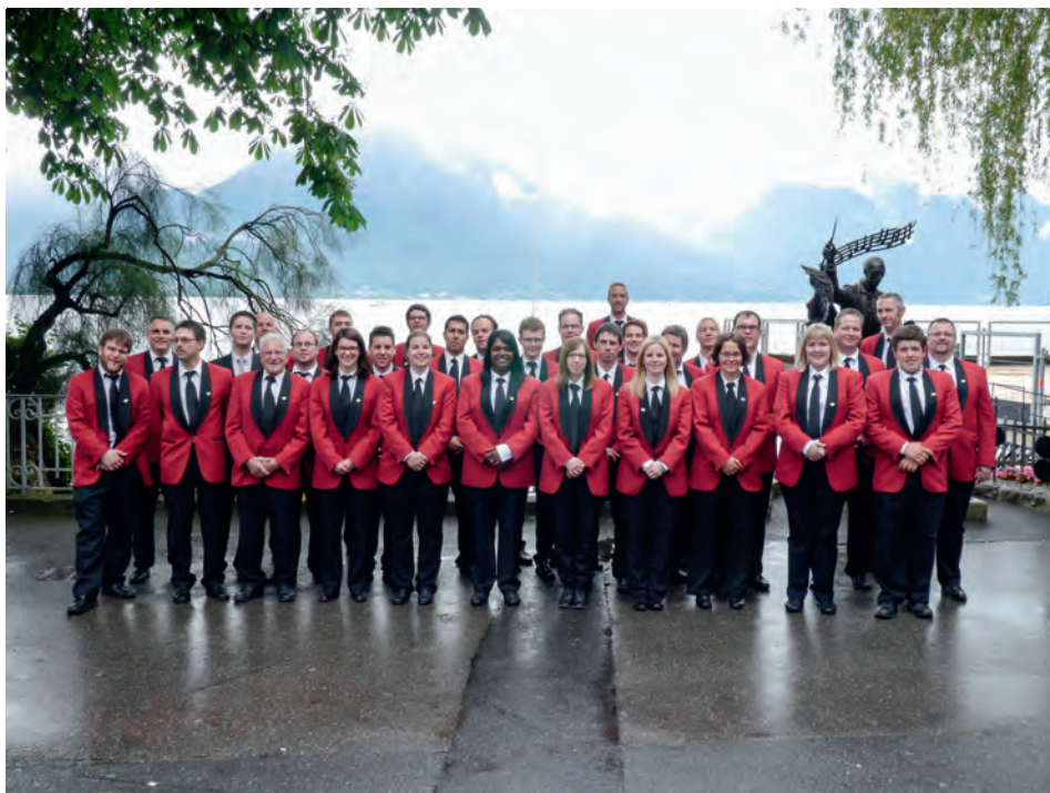
Fanfare L'Espérance Chevez