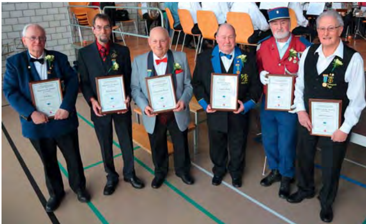
Les vétérans CISM pour 60 ans de musique