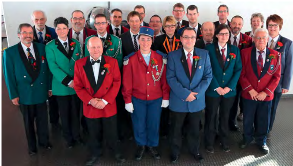
Les vétérans jurassiens pour 25 ans de musique