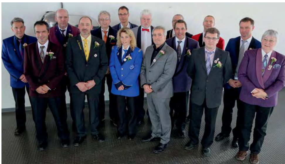
Les vétérans fédéraux pour 35 ans de musique