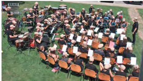
Camp de musique de la FJM en 2015

Ils sont 650 !... ce qui représente un beau 36% et ceci sans compter tous les jeunes musiciennes et musiciens dans les sociétés de cadets et groupes de formation qui ne sont pas encore dans les rangs des sociétés de la FJM.