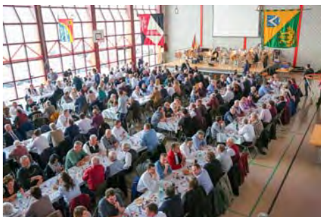
Une parfaite organisation à Prêles sous la neige

La parfaite organisation a été réalisée par la Fanfare Harmonie de Prêles et la Société de Musique l'Espérance de Lamboing qui ont été remerciées par applaudissements.