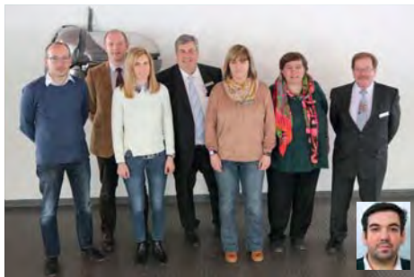
Le comité central de la FJM en 2016

En 2015, une directive interne a été établie concernant les indemnités du comité central et de la commission de musique afin d'harmoniser les frais comme les déplacements et repas. Les membres sont bénévoles.