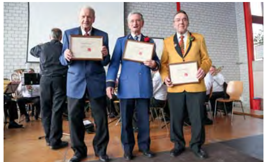
Les vétérans ASM pour 70 ans de musique