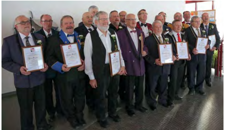
Les vétérans jurassiens pour 50 ans de musique