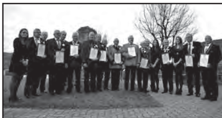
... 50 ans de musique ...