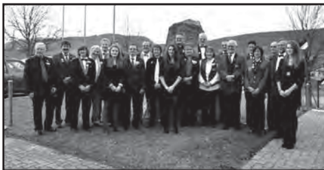
... 35 ans de musique ...