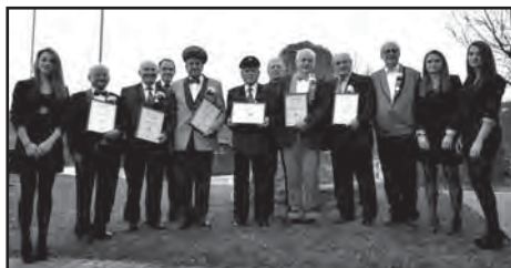
... 60 ans de musique ...