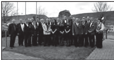
Les musiciens méritants : 25 ans de musique ...