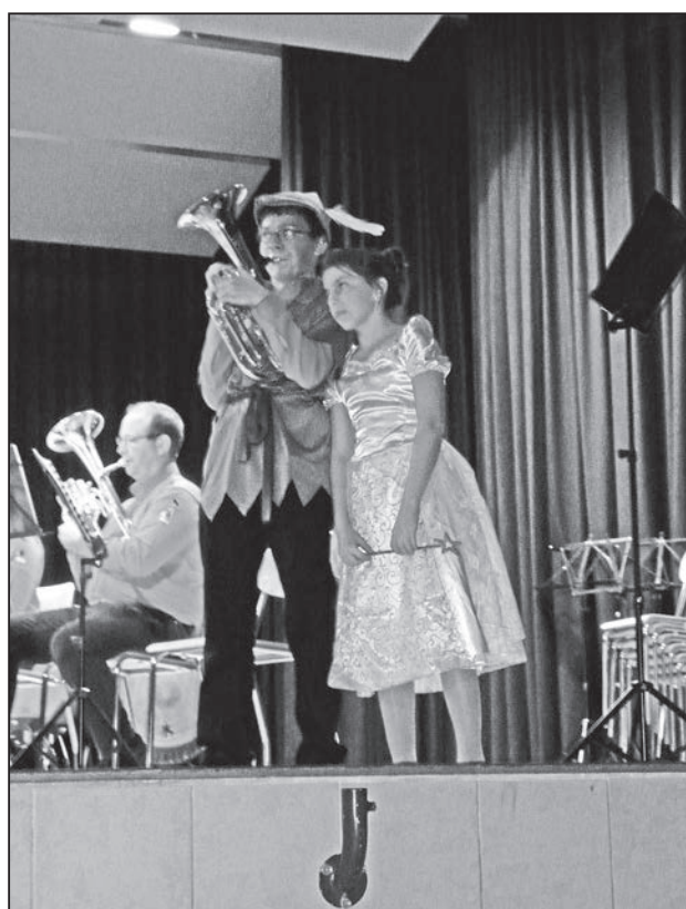
Quand la fée rencontre son prince