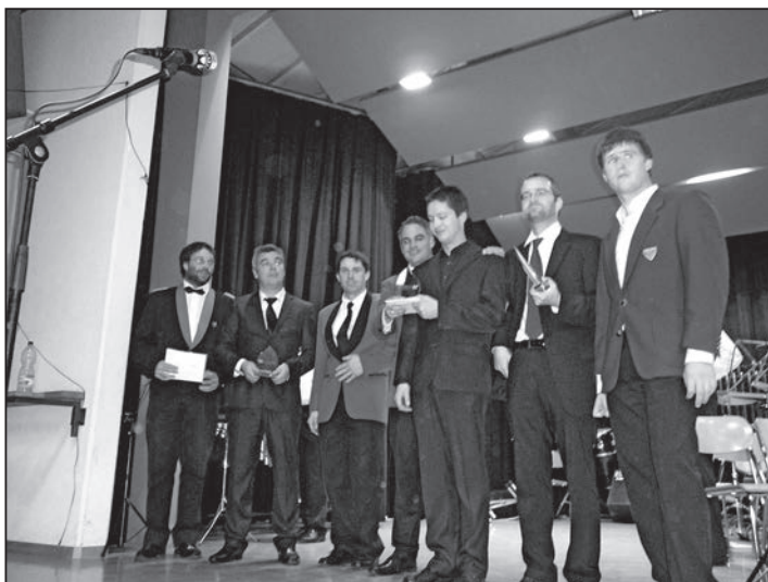
Les représentants des vainqueurs du groupe A