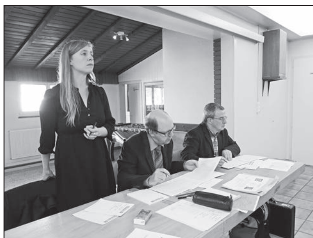
Le jury en pleine action