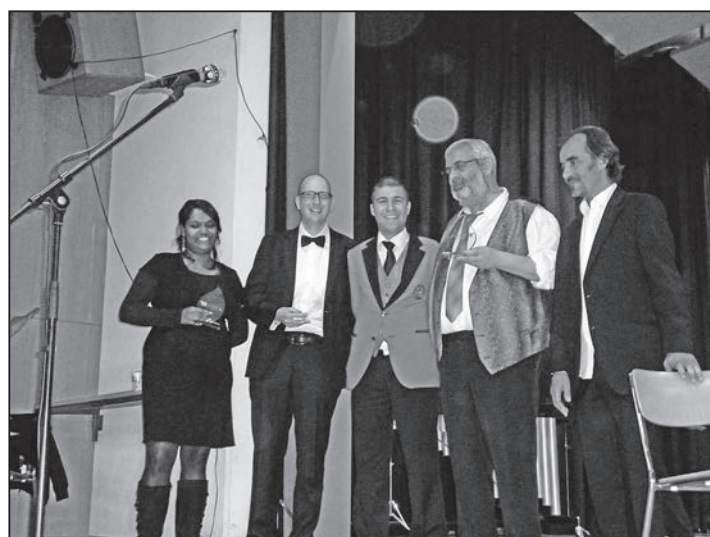
Les représentants des vainqueurs du groupe B