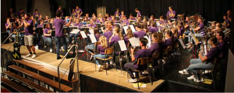
En concert au Noirmont