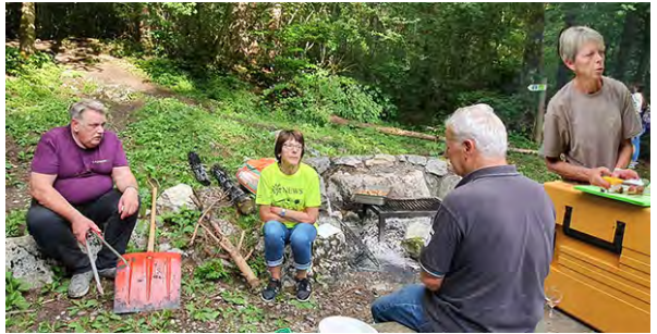
L'équipe de cuisine