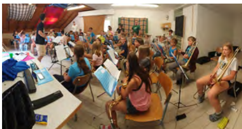
Les Kids United en répétition