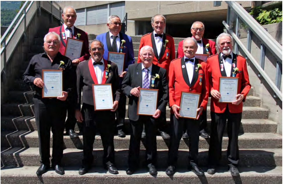
Les vétérans CISM pour 60 ans en 2021 et 2022