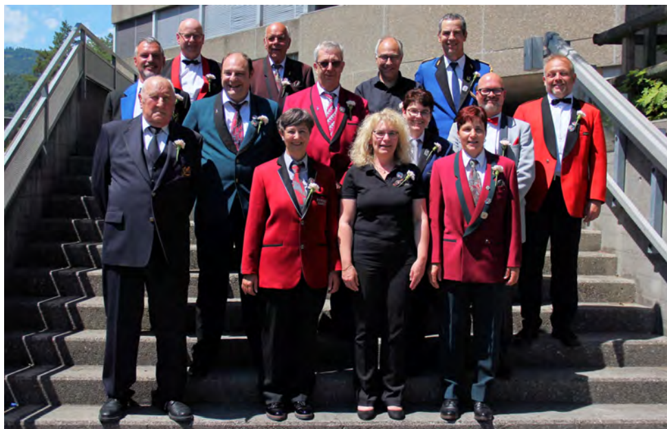
Les vétérans ASM pour 35 ans en 2022