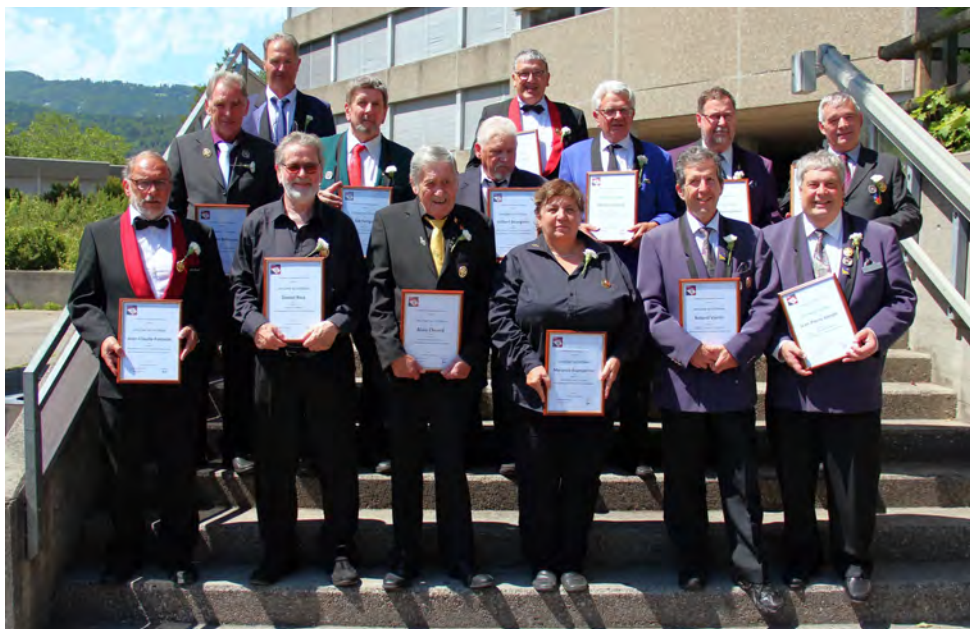
Les vétérans FJM pour 50 ans en 2022