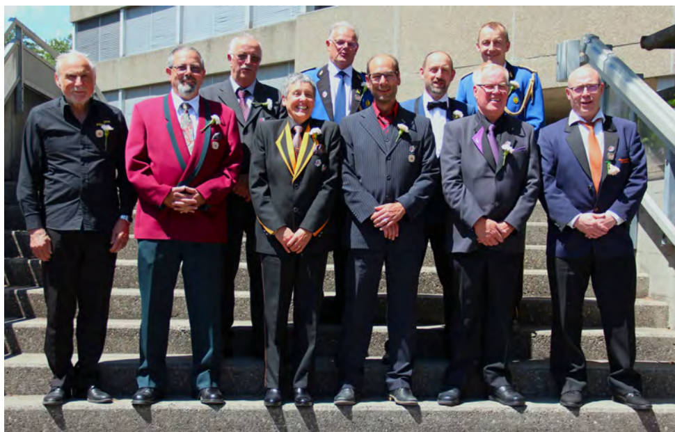
Les vétérans ASM pour 35 ans en 2021