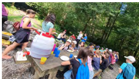
Soirée grillades en forêt