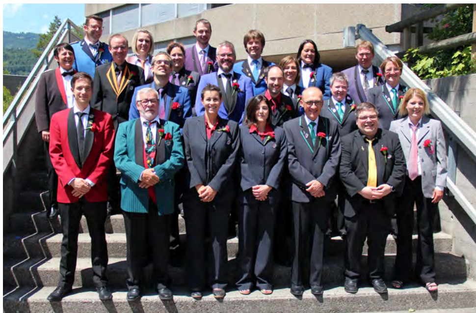
Les vétérans FJM pour 25 ans en 2021