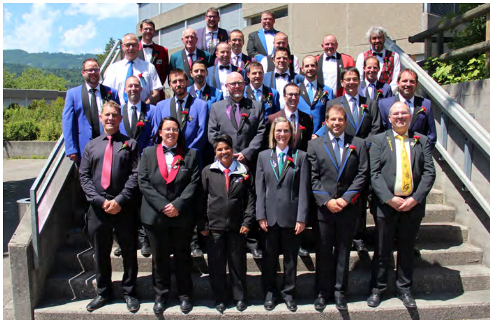
Le vétérans FJM pour 25 ans en 2022