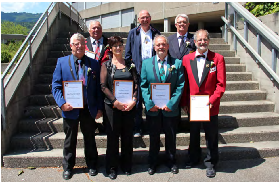
Les vétérans FJM pour 50 ans en 2021