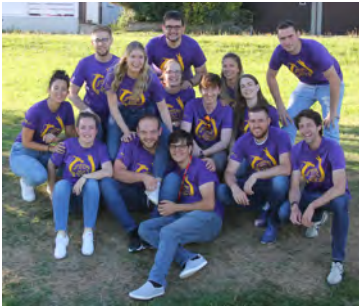
Une équipe d'encadrement incroyable