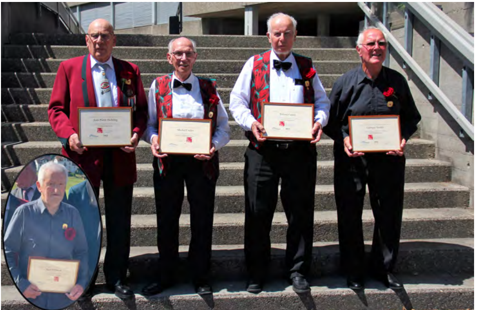
Les vétérans ASM pour 70 ans en 2021 et 2022