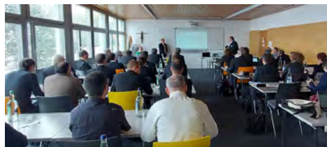
Présentation des travaux en cours de l'ASM