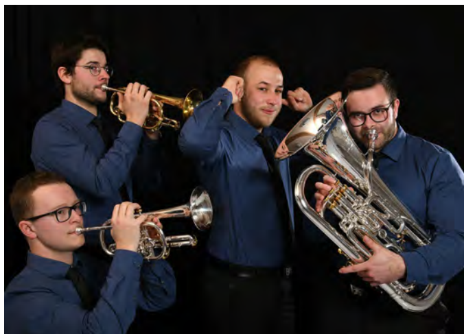
Illumination Brass Quartet, champion « Ensembles à vent »