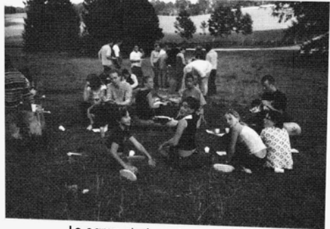
Le camp c'est aussi du champ !