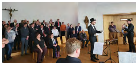
La présentation du cor d'harmonie

Cette œuvre met en scène les instruments de musique à vent et est destinée à la promotion dans les écoles.