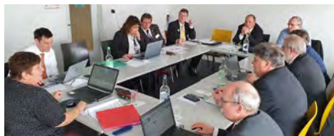
L'atelier de gestion des membres parlant d'Hitobito

De nombreux thèmes ont été abordés dans 4 ateliers : comités centraux, commissions de musique, tambours et gestion des membres.