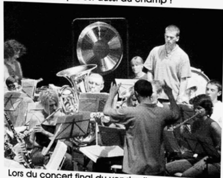
Lors du concert final du vendredi soir à Glovelier