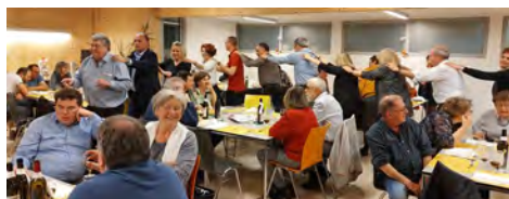
Une belle soirée récréative qui soude les amitiés

Comme à l'accoutumée, un repas, une soirée festive et la poursuite de la soirée au carnotzet ont terminé la journée du samedi.