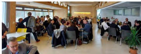
La salle des repas au Centre Saint-François

Après deux années de rencontres écourtées ou en visioconférences, la Rencontre des associations de musique Romandes et Tessinoise s'est déroulée, les 2 et 3 avril au Centre Saint-François à Delémont.